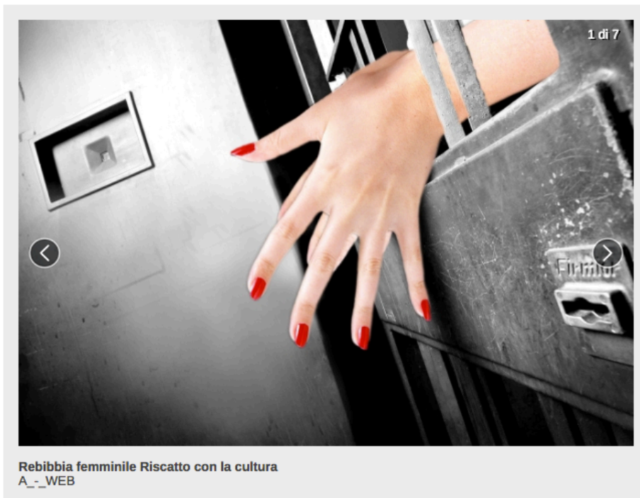
Rebibbia femminile Riscatto con la cultura A_-WEB